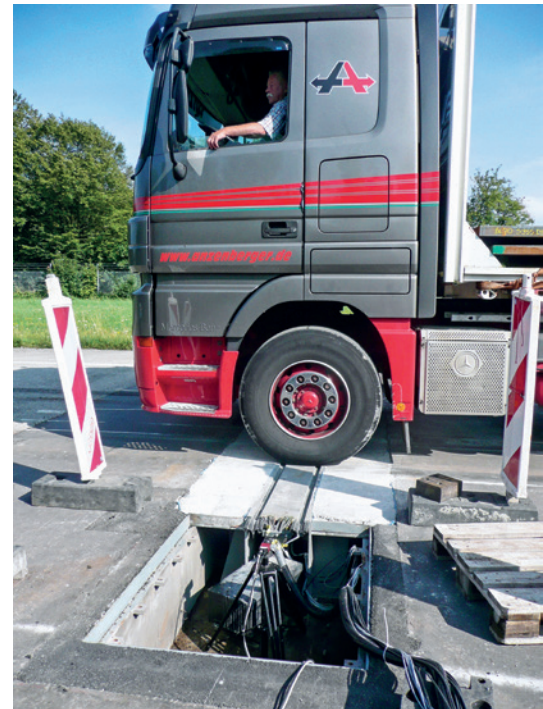
Die verbreiterte Lamelle der intelligenten Fuge wird beim Überrollen vollständig vom Lkw-Reifen belastet.

Basis der intelligenten Fuge ist eine Schwenktraversen-Dehnfuge DS160. Damit die Achslast an einer (= 1) Lamelle gemessen werden kann, wurde diese auf 220 mm verbreitert: So wird diese Lamelle beim Überrollen vollständig vom Lkw-Reifen belastet.