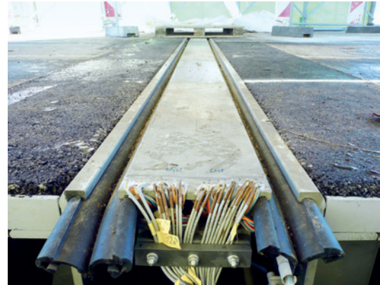
Teststand einer intelligenten Schwenktraversen-Dehnfuge, die Achslasten mit einer Genauigkeit von 10% ermittelt.

Lager sind elementare Bauteile der Brücke. Viele Zustandsänderungen des Bauwerks wirken sich unmittelbar auf sie aus. Daher sind sie bestens geeignet für ein laufendes Brückenmonitoring. Dieses Monitoring ist angesichts der zunehmenden Verkehrslast dringend notwendig.