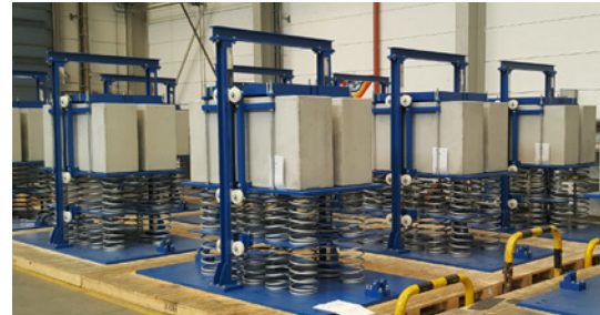
Die Feder-Masse-Dämpfer in der MAURER-Produktionshalle.

Die Hydraulikdämpfer wurden in den Kolbenführungen und -dichtungen nahezu reibungslos und verschleißfrei ausgelegt: mit einer berührungslosen inneren Dichtung. Das gesamte Dämpfersystem wurde auf 400 km aufaddierten Schwingungsweg getestet. Dabei entstanden Temperaturen von bis zu 160 °C, denen das System ohne Verschleiß und Leckage standhielt. Das heißt: Auch wenn der Wind lange weht, kommt es weder zu Ermüdung in den Federn noch zu Verschleiß in den Hydraulikdämpfern. Die Brückenschwingung wird somit effektiv und dauerhaft auf 50 Jahre und länger eingebremst.