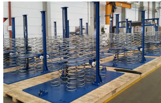
Federn für Mumbai: Sie sind aus extrem hartem Federstahl, damit sie die hohen Schwingungsamplituden von \pm 400 mm dauerhaft aushalten. Gut zu sehen vorne die vertikalen Führungen mit kugelgelagerten Rollen, welche die Masse „in der Spur“ halten.